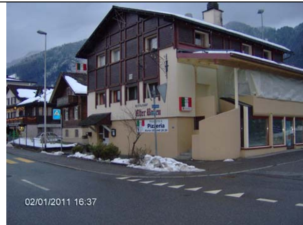
Abb. 1: Rest. Alter Raben (auf der rechten Strassenseite). Hier links abbiegen.