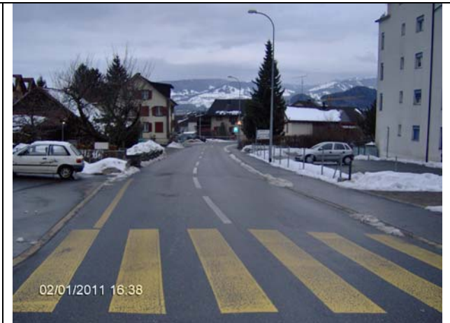
Abb. 3: Unmittelbar nach dem Einbiegen in die Bahnhofstrasse.