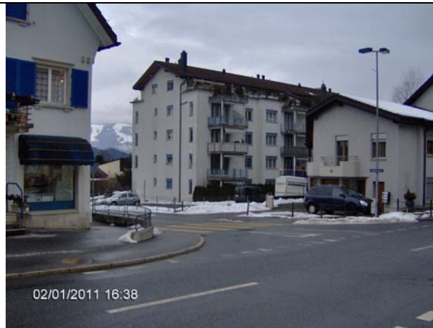
Abb. 2: Einbiegen in die Bahnhofstrasse (beim Restaurant Alter Raben).