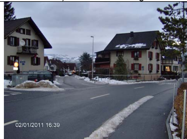
Abb. 4: Nach rund 100m auf der Bahnhofstrasse „halbrechts“ einbiegen.