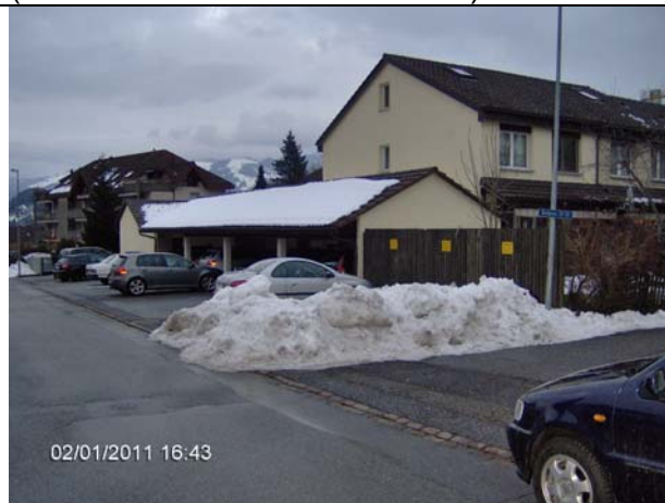
Abb. 5: Besucherparkplätze bei der Siedlung.